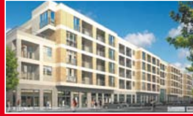
EBB NIERUCHOMOŚCI OSIEDLE GRAFITOWE