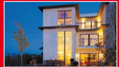
MAGNOLIA OSIEDLE MAGNOLIA