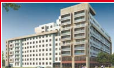
ROBYG CITY APARTMENTS