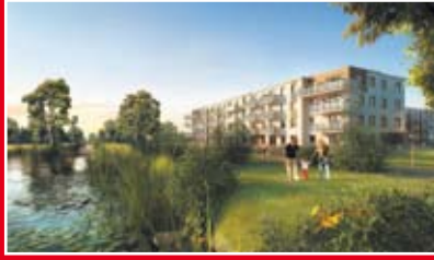
DOM DEVELOPMENT MIASTECZKO REGATY