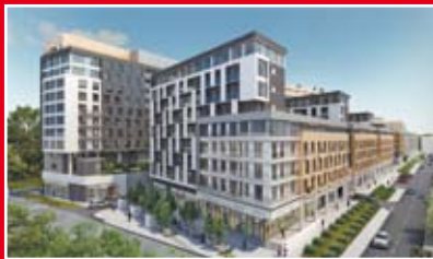
GANT DEVELOPMENT KASKADA NA WOLI