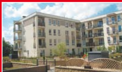
PRESTIGE OSIEDLE RÓŻ