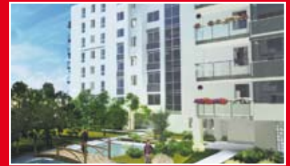
RED DEVELOPMENT OSIEDLE ALPHA