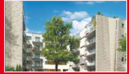
BUDIMEX NIERUCHOMOŚCI OSIEDLE IDZIKOWSKIEGO