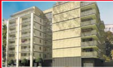
MELITA INVESTMENTS RIVERSIDE APARTMENTS