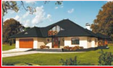
APM POLAND OSIEDLE WOLICA