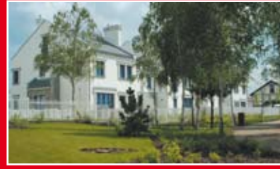
BOUYGUES IMMOBILIER LE VILLAGE - ETAP VILLA CREATION