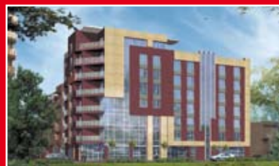
ROGOWSKI DEVELOPMENT APARTAMENTY MIŃSKA TRAFÓ