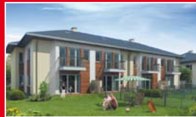
KREATOR DOM OSIEDLE ROXANA