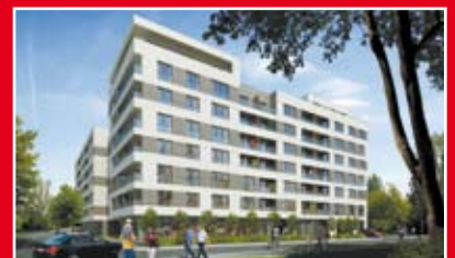
RONSON DEVELOPMENT VERDIS