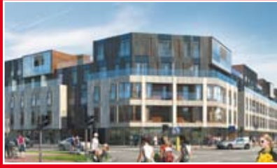
ACCIONA NIERUCHOMOŚCI WILANÓW - ATMOSFERA APARTAMENTY