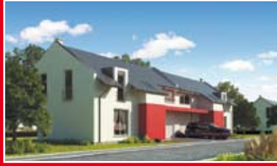
DOMPOL OSADA KAMPINOS