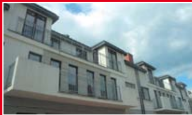
HTC INVEST KASZMIROWY DOM