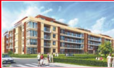
MILL-YON AURA PARK