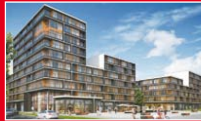
PRO URBA 19. DZIELNICA